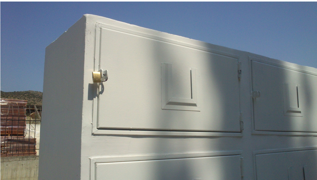
Εικ. Κατασκευή - τοποθέτηση οστεοθηκών, στο κοιμητήριο της Ν.Αγχιάλου.